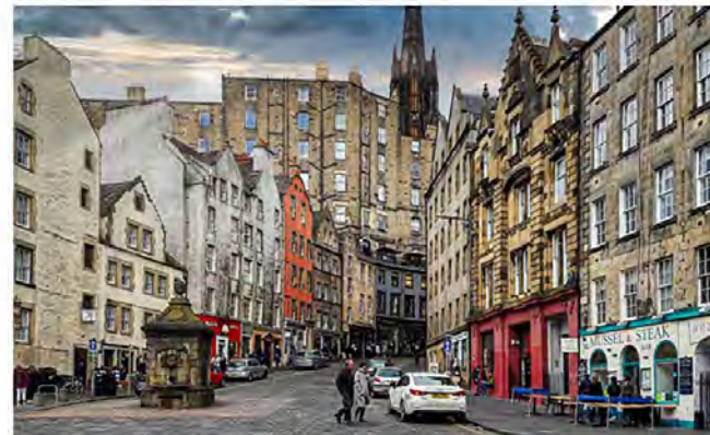
Altstadt von Edinburgh: vom Grassmarket ist es nicht weit zum Edinburgh Castle.

Während unserer Exkursion werden Sie mit Grundbegriffen der Fotografie vertraut und üben sich täglich im Umgang mit Ihrer Kamera. Sie lernen Ihren Blick für das Wesentliche eines Bildes zu schärfen und erfahren allerlei zu Bildaufbau und -Komposition. Wir spielen mit Licht und Schärfentiefe und können unvergessliche Momente in grandiosen Bildern festhalten.