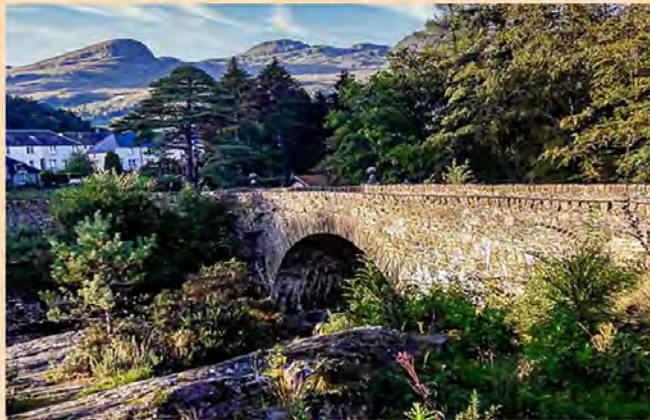
Am Ortsrand von Killin führt eine Brücke über die Wasserfälle von Dochart.